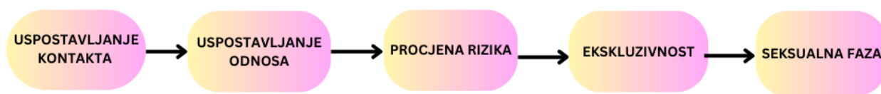
Slika 1. „Grooming“ u suvremenim tehnologijama (prema Burton i Reid, 2017).

„Grooming“ možemo opisati kao mamljenje žrtve koje započinje tako da počinitelj nastoji prvo stupiti u kontakt s djetetom i steći povjerenje koje je temelj za kasnije zlostavljanje (Burton i Reid, 2013). Sam pojam „groominga“ ili poznati još i kao vrebovanje, je proces u kojem odrasla osoba putem interneta i društvenih mreža nastoji izgraditi povjerenje djeteta da bi ga kasnije navela da sudjeluje u seksualnim komunikacijama, dijeljenju eksplicitnih sadržaja pa čak i sudjelovanju u seksualnim zlostavljачkim aktivnostima uživo (Raguž i su., 2021). Zlostavljači se često koriste raznim metodama koje uključuju ponajprije uspostavljanje odnosa povjerenja koje postepeno prelazi u seksualne teme, a zatim slanje slika i videa seksualno eksplicitnog sadržaja koje na kraju može dovesti i do seksualnih aktivnosti (Raguž i sur., 2021). Situacija u kojoj odrasla osoba upućuje takve zahtjeve djetetu sagledava se u posebnom kontekstu zbog značajne razlike u znanju i moći odrasle osobe i djeteta. S obzirom na to da taj kontekst, govorimo o online vrebovanju ili tkv. „online groomingu“ (Raguž i sur., 2021; Roje Đapić i sur., 2021). Hrvatsko zakonodavstvo ovo ponašanje obuhvaća kaznenim djelima „Iskorištavanje djece za pornografiju“ prema članku 163. Kaznenog zakona.