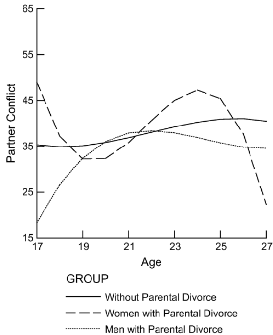
Slika 2.2. Sukob partnera pod utjecajem razvoda roditelja.

Poveznica je vidljiva i s socioekonomskim statusom, gdje se niži socioekonomski status roditelja povezuje s više sukoba. Osim utjecaja razvoda roditelja, vlastita povijest razvedenih brakova također povećava vjerojatnost bračnih poteškoća. Kada gledamo odnos braka sa suživotom, partneri koji nisu vjenčani, a žive zajedno prijavljuju više sukoba i slabiju kvalitetu odnosa (Chen i sur., 2006).