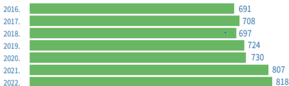
Slika 3.3.2. Djeca na smještaju i organiziranom stanovanju u domovima za djecu bez odgovarajuće roditeljske skrbi i centrima za pružanje usluga u zajednici 2016. - 2022.

Usporedno s prethodnim podacima na slici 3.3.2 moguće je vidjeti stanje od 2016 do 2022. godine. Slika prikazuje podatke koji su uzeti od svih ustanova odnosno njih dvadeset. Ono što podaci prikazuju je to da se situacija nije poboljšala odnosno da se brojke smještavanja djece povećavaju. Od 818 djece koja su bila smještena u ustanovama 568 je na smještaju i 250 je u organiziranom stanovanju. Iz podataka se može zaključiti da je manje djece smješteno u deinstitucionalizacijske oblike skrbi što znači da proces deinstitucionalizacije stagnira.