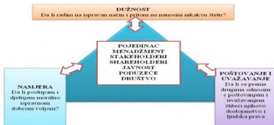
Slika 2.5.1: Trokut etičkog odlučivanja prema deontološkim principima

Deontologija je pristup etici kojem je srž da se svaka osoba u svom etičkom djelovanju vodi motivacijom, a ne krajnjim rezultatom. Smatra da je etika zasnovana na obavezama, dužnosti, pravima i načelima. Deontolozi svoje odluke baziraju na jedinstvenim načelima, odnosno vrijednostima koje su veće od vremena i kulturnih i religijskih ograničenja. Josephson je identificirao 10 univerzalnih principa koji čine temelj etičkog života a to su: poštenje, integritet, ispunjavanje obećanja, istinitost, pravednost, briga za druge, poštovanje, odgovorno građanstvo, težnja ka savršenstvu, odgovornost (Berčić 2008. prema Ivaniš 2014.).