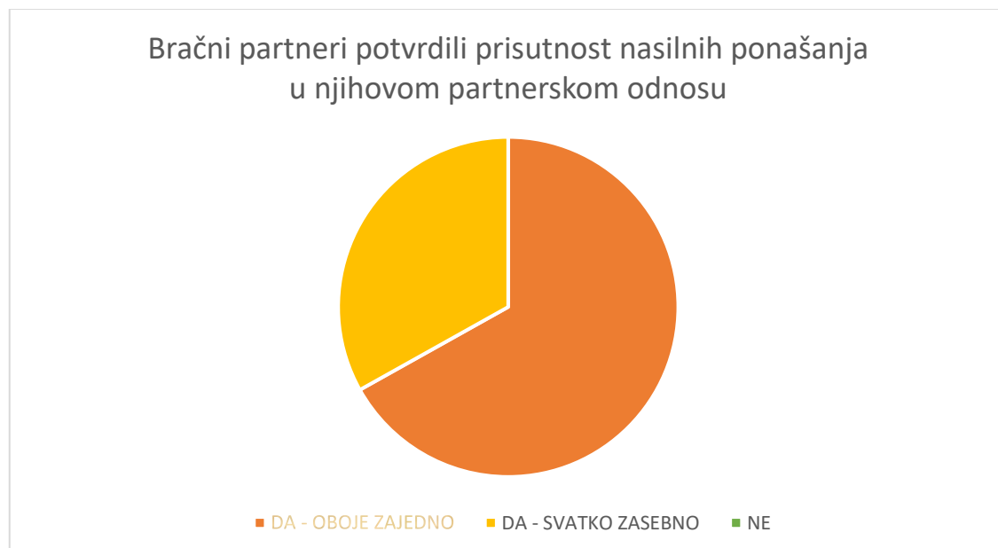
Slika 1. Prikaz rezultata o ne/postojanju direktnih upita o prisutnosti nasilničkih ponašanja u partnerskom odnosu

Sudionice su također odgovorile na pitanje da li se bračne partnere direktno provjerava je li bilo nasilničkih ponašanja u njihovom partnerskom odnosu. Temeljem zaprimljenih odgovora utvrđeno je kako su predstavnice četiri od ukupno šest stručnih timova navele da su oba bračna partnera zajedno i direktno upitali tijekom postupka obveznog savjetovanja prije razvoda braka je li bilo nasilničkih ponašanja u njihovom partnerskom odnosu, dok su predstavnice dva od šest timova navele da su taj upit direktno postavili svakom partneru zasebno.