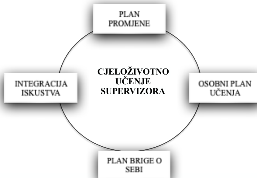
Grafički prikaz 2. Model cjeloživotnog učenja supervizora - integracija iskustva i usavršavanje kompetencija supervizora

Model cjeloživotnog učenja supervizora je cikličan proces koji nikada ne završava, a uključuje: (1) plan promjene, (2) osobni plan učenja, (3) plan brige o sebi i (4) integraciju iskustva. Svaka aktivnost je fluidna i međuovisna, jezgrovita i slojevita, realistična i primjenjiva, utemeljena na osobnom iskustvu supervizora i prilagođena individualnim potrebama i životnim i profesionalnim okolnostima supervizora. Model je životan i promjenjiv, odnosno prilagodljiv trenutnim potrebama supervizora. U idućim poglavljima, raspraviti će se svaka predložena aktivnost zasebno.