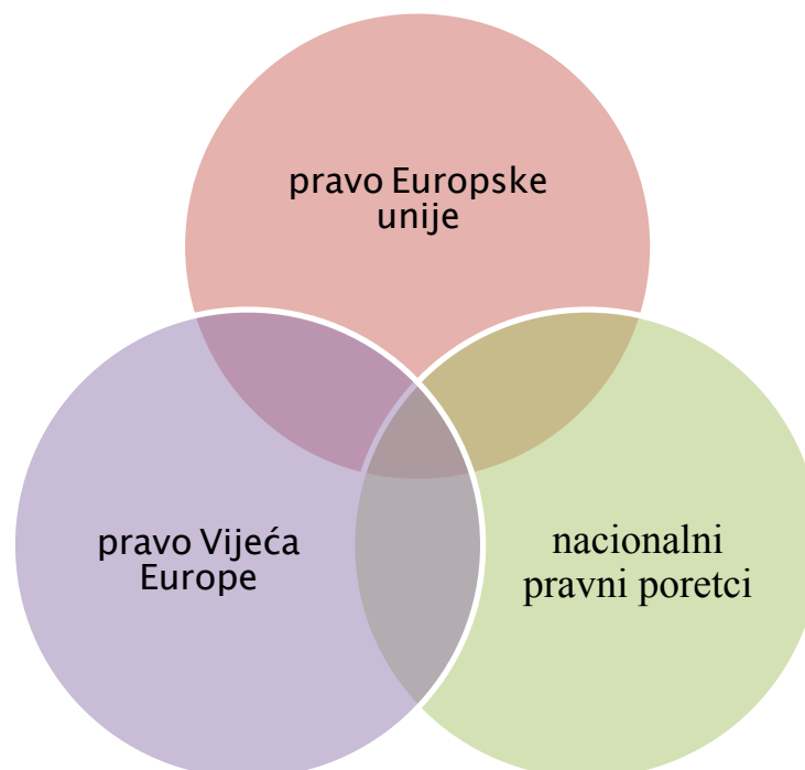
Slika 4 – Položaj ljudskog dostojanstva u europskom pravnom poretku (u širem smislu)

Dakle, ako bismo nastojali pozicionirati ljudsko dostojanstvo unutar složenog pravnog poretka koji karakterizira EU, ono je zaštićeno u trijasi međusobno isprepletenih pravnih sustava (Slika 4):