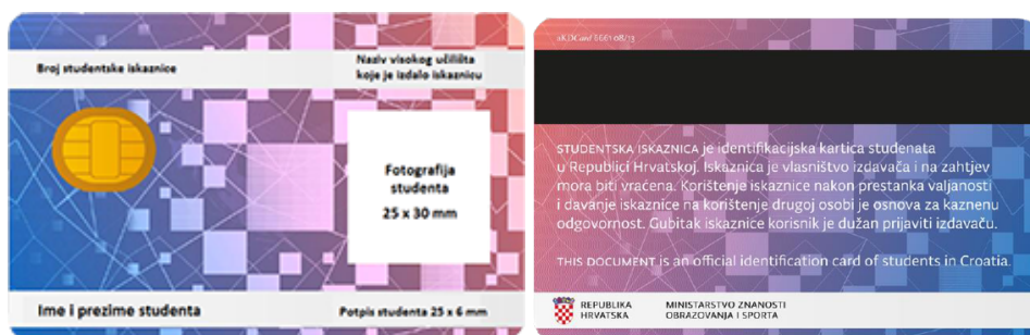
Slika 4. Studentska iskaznica.

visokog učilišta iz Upisnika visokih učilišta Ministarstva, ime i prezime studenta, OIB studenta, broj studentske iskaznice, područje za dodatne podatke i usluge visokog učilišta i područje za dodatne vanjske usluge na čipu studentske iskaznice te ime i prezime studenta, broj studentske iskaznice i OIB studenta na magnetskoj traci studentske iskaznice. Podaci koji su otisnuti na studentskoj iskaznici su broj studentske iskaznice, naziv visokog učilišta koje je izdalo iskaznicu, ime i prezime studenta, potpis studenta i fotografija studenta. 58 Studentska iskaznica je javna isprava kojom se dokazuje status studenta, neprenosiva je i osnovna je isprava na temelju koje studenti ostvaruju pravo na prehranu, razne popuste i ostala prava koja im pripadaju na temelju njihovog statusa. Osim za ostvarivanje propisanih i dodijeljenih prava, studentska iskaznica nužna je i za prijavu ispita.