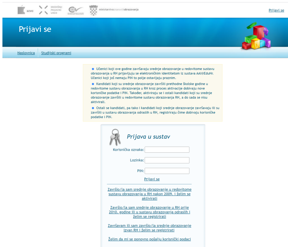
Slika 2. Prijava putem Nacionalnog informacijskog sustava prijave na visoka učilišta (NISpVu)

broj mobitela te adresa elektroničke pošte putem čega će se s njima vršiti daljnja komunikacija. Nakon uspješno završenog procesa registracije kandidati zaprimaju korisničke podatke na broj mobitela koji su naveli prilikom registracije.