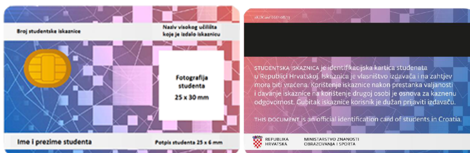
Slika 4. Studentska iskaznica.

visokog učilišta iz Upisnika visokih učilišta Ministarstva, ime i prezime studenta, OIB studenta, broj studentske iskaznice, područje za dodatne podatke i usluge visokog učilišta i područje za dodatne vanjske usluge na čipu studentske iskaznice te ime i prezime studenta, broj studentske iskaznice i OIB studenta na magnetskoj traci studentske iskaznice. Podaci koji su otisnuti na studentskoj iskaznici su broj studentske iskaznice, naziv visokog učilišta koje je izdalo iskaznicu, ime i prezime studenta, potpis studenta i fotografija studenta. 58 Studentska iskaznica je javna isprava kojom se dokazuje status studenta, neprenosiva je i osnovna je isprava na temelju koje studenti ostvaruju pravo na prehranu, razne popuste i ostala prava koja im pripadaju na temelju njihovog statusa. Osim za ostvarivanje propisanih i dodijeljenih prava, studentska iskaznica nužna je i za prijavu ispita.