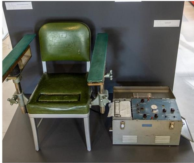
Slika 1. Poligrafski uređaj Keeler, Model 6303 27

Moderni poligrafi više ne koriste olovke pričvršćene za tambure za pisanje tintom na roli papira koju pokreće satni mehanizam na način na koji su radili izvorni Keelerovi poligrafski modeli (Slika 1.). 26