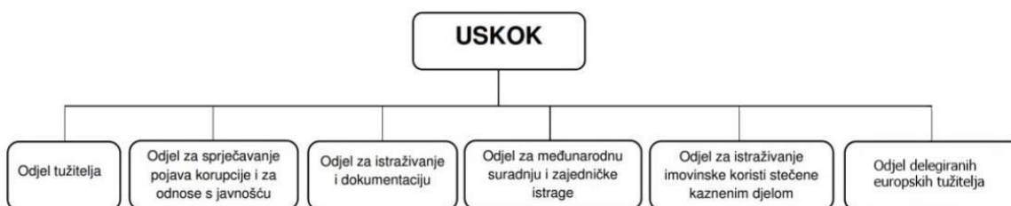
Slika 1: Ustrojstvo Uskok-a