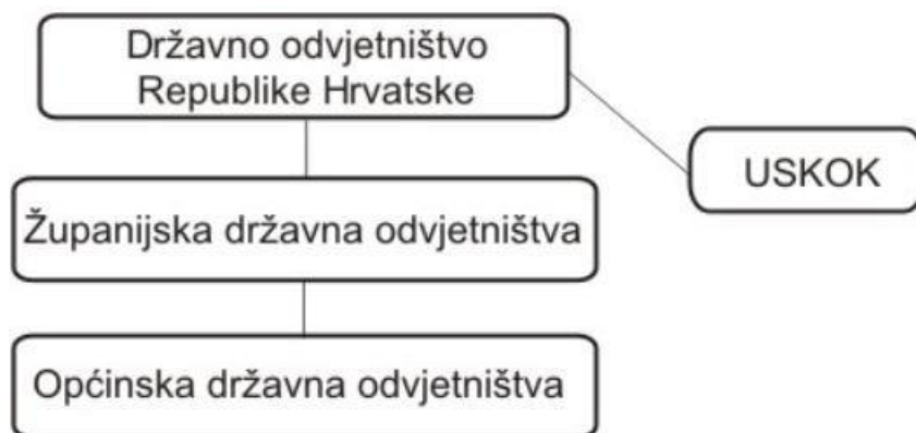
Slika 1: Grafički prikaz USKOK-a u organizaciji Državnog odvjetništva RH