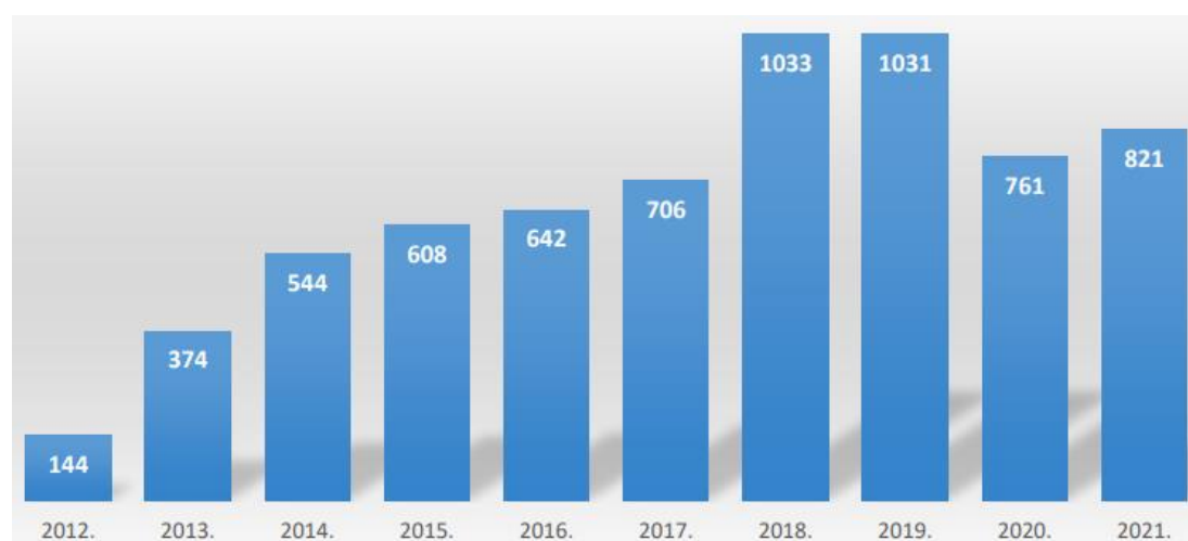
Slika 1: Grafički prikaz kretanja broja provedenih savjetovanja s javnošću od 2012. do 2021. godine