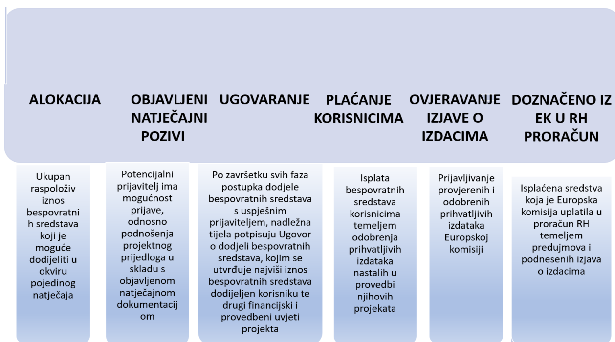
Tablica 1. Tijek novca iz fondova EU