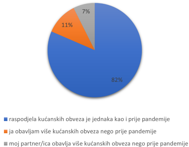
Slika 2 Raspodjela kućanskih poslova u vrijeme ispunjavanja ankete

Slika 2 prikazuje odgovore koji su se odnosili na vrijeme u kojem je ispunjavana anketa te možemo vidjeti kako najveći broj sudionika i dalje navodi da je raspodjela kućanskih poslova jednaka kao i prije pandemije (81,5%, N=67), dok nekoliko sudionika ipak navodi da sada obavlja više kućanskih poslova nego li prije pandemije (11,1%, N=9), a najmanje sudionika navodi da njihov partner/partnerica obavlja više kućanskih poslova nego li prije pandemije (7,4%, N=6).