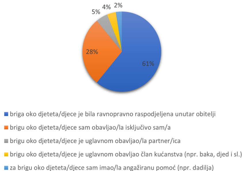
Slika 3 Raspodjela brige oko djeteta/djece za vrijeme lockdowna

Na pitanje oko raspodjele brige oko djeteta/djece poslije pandemije odnosno za vrijeme ispunjavanja ankete Slika 4 prikazuje da je najveći broj sudionika odgovorio da je raspodjela brige oko djeteta/djece ostala jednaka kao i prije pandemije (85,2%, N=69), dok nekolicina sudionika navodi kako nakon pandemije imaju više brige oko djeteta/djece nego prije pandemije (11,1%, N=9). Valja napomenuti da uzorak ovog istraživanja ne dozvoljava analize po spolu (dominantno su upitnik ispunile žene), no indikativni su podaci koji ukazuju na malo povećanje u neravnopravnoj raspodjeli kućanskih poslova i brige oko djeteta/djece uslijed pandemije. U konačnici, to su potvrdila i druga istraživanja (npr. UNESCO, 2020; Morrica i sur., 2021; Picken i sur., 2021; Blum i Dobrotić, 2022.).