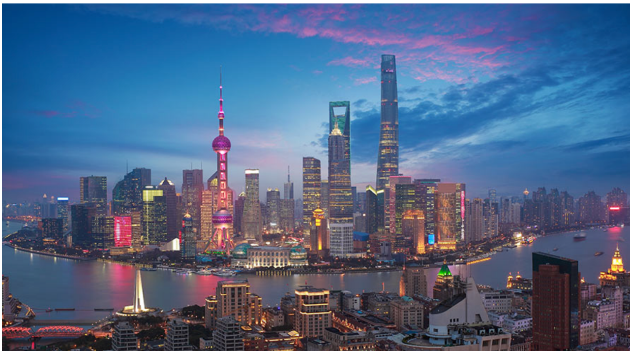
Slika 5 Šangaj – vodeći pametni grad