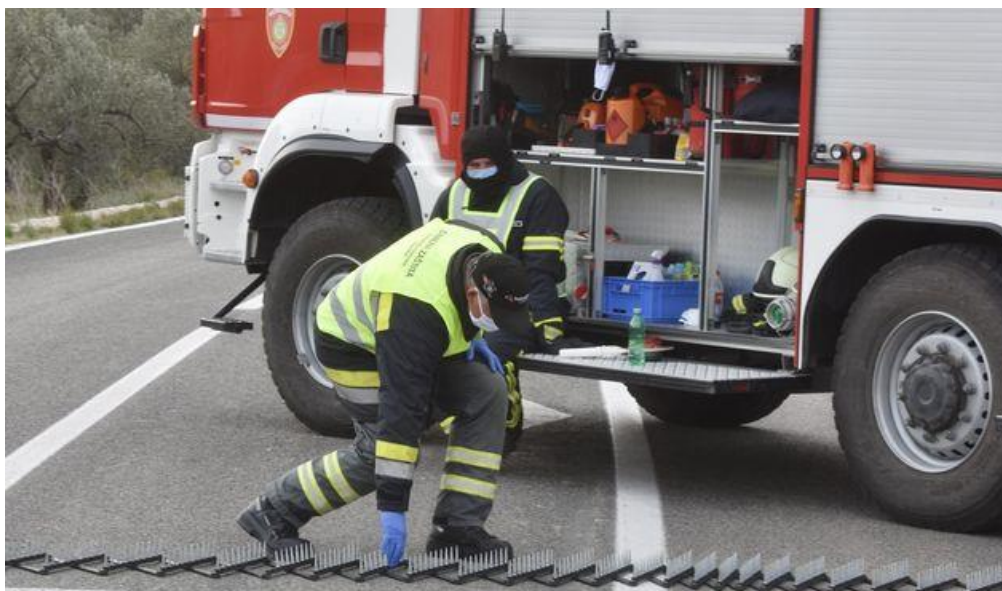
Slika 1. Blokada otoka Murtera