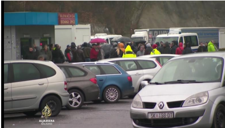
Slika 1. Gužve na granicama zbog ograničenja kretanja ljudi