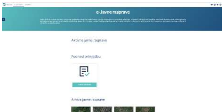
Slika 1. Službena web stranica e-Javne rasprave

E-Javne rasprave je usluga koja građanima omogućuje sudjelovanje u javnim raspravama te podnošenje prijedloga, mišljenja ili primjedbi na prijedloge prostranih planova putem online aplikacija. Aplikacija omogućuje uvid u informacije o prijedlogu plana, lociranje zahtjeva u prostoru te sadrži obrazac koji omogućuje upućivanje prijedloga, mišljenja ili primjedbe na prijedlog plana. Za sudjelovanje u e-Javnoj raspravi potrebno je registriranje preko NIAS sustava prijavom u aplikaciju e-Građani, te automatski povezivanje sa sustavom gradske uprave. Na web stranici Grada Zagreba dostupne su aktivne javne rasprave, obrazac za podnošenje primjedbe na javnu raspravu te arhiva javnih rasprava. Tijekom izrade ovog rada, aktivnih javnih rasprava nije bilo, a u arhivi je bilo vidljivo dvanaest javnih rasprava. Ključni ciljevi aplikacije e-Javne rasprave su smanjiti vrijeme zaprimanja mišljenja, prijedloga i primjedbi na prijedlog prostornog plana, smanjiti vrijeme i ubrzati proceduru obrade zaprimljenih mišljenja, prijedloga i primjedbi, osiguranje vjerodostojnosti podnositelja mišljenja, prijedloga i primjedbi, sigurno i povjerljivo jedinstveno mjesto komunikacije sa građanima i poslovnim subjektima, vjerodostojna verifikacija dokumenata te jednostavna i brza produkcija javnih rasprava. 10