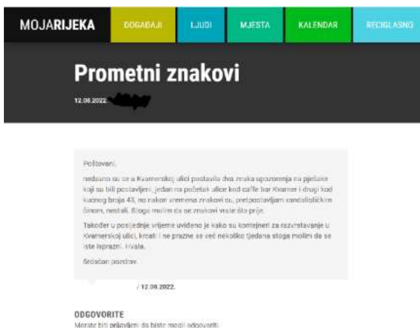
Slika 3. Primjer objave u rubrici Reci glasno

Rubrika Reci Glasno namijenjena je poboljšanju i razvoju zajedničkog životnog prostora. Svojim objavama, komentarima, upitima, pohvalama i pritužbama, riječju i fotografijama građani mogu doprinijeti kvaliteti života u Rijeci. Građani se moraju registrirati, odnosno prijaviti na web stranici Grada Rijeke kako bi nešto objavili ili pitali. Na pitanja odgovaraju osobe iz gradske uprave ili će se odgovor potražiti u širem gradskom sustavu – gradskim komunalnim društvima, javnim gradskim ustanovama i sl.. Rubrika Reci Glasno nije namijenjena komentiranju tuđeg pitanja ili mišljenja, već iznošenju vlastitog i to unutar teme. Nije dozvoljeno vrijeđati druge korisnike te rubrike, institucije ili osobe. Svako ne pridržavanje tih uputa rezultira uklanjanjem objave bez prethodnog upozorenja 17 .