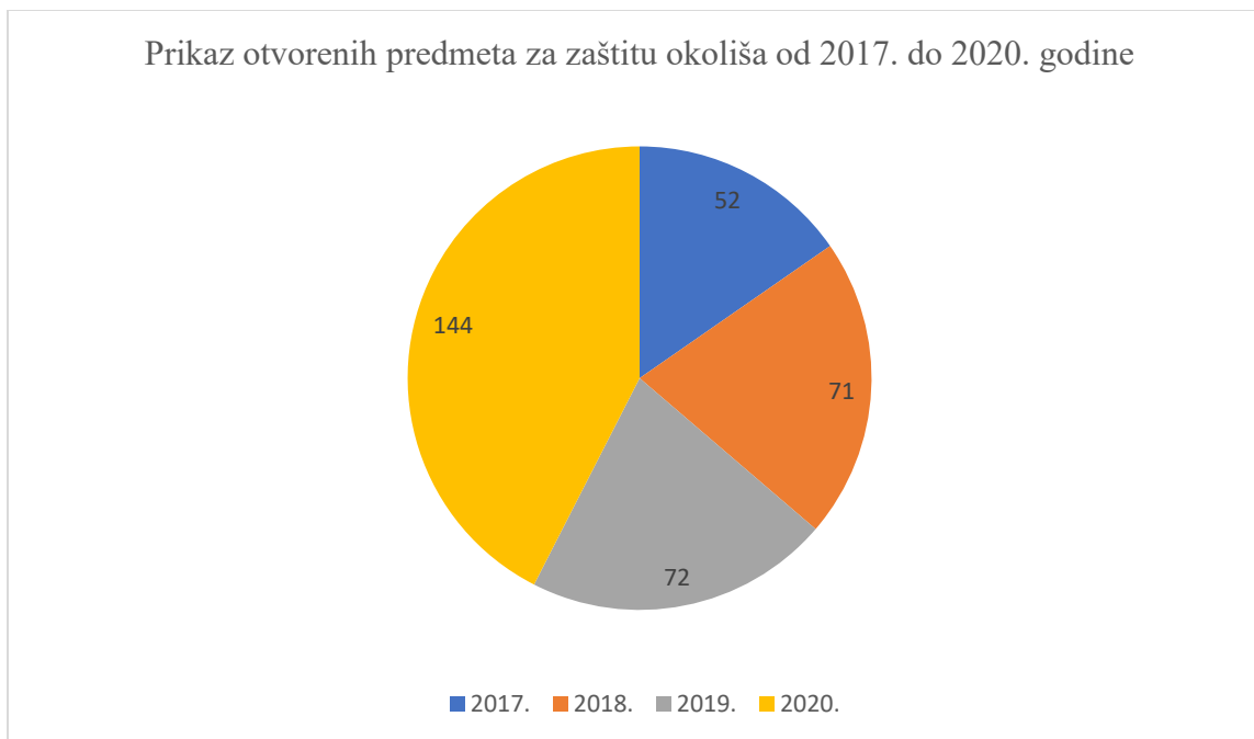
Graf 2. Otvoreni predmeti za zaštitu okoliša od 2017. do 2020. godine