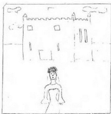
Figure 7.24 Sad and Lonely Princess

Primjer crteža za iskazivanje emocija i stavova: tuga (4.1.) i suicidalnost (4.2.)