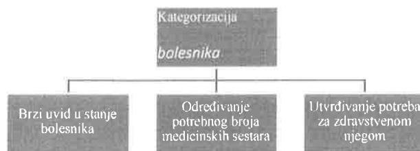
Grafikon 1. Funkcija kategorizacije bolesnika.

Na grafikonu 1. Prikazana je funkcija kategorizacije bolesnika.