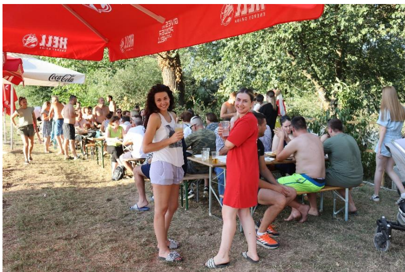
Slika 3.2.4. Pikećanski dernek

- S.L. (29) o provođenju slobodnog vremena ljeti