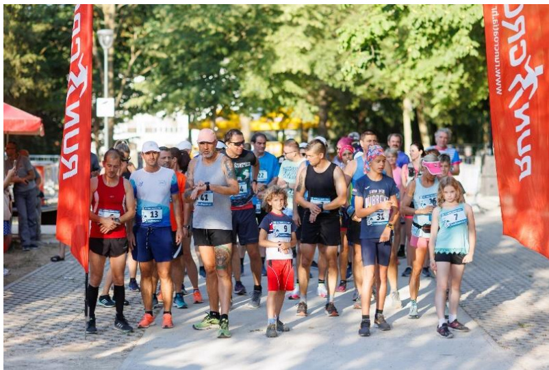
Slika 3.2.1 Thrill Blues run