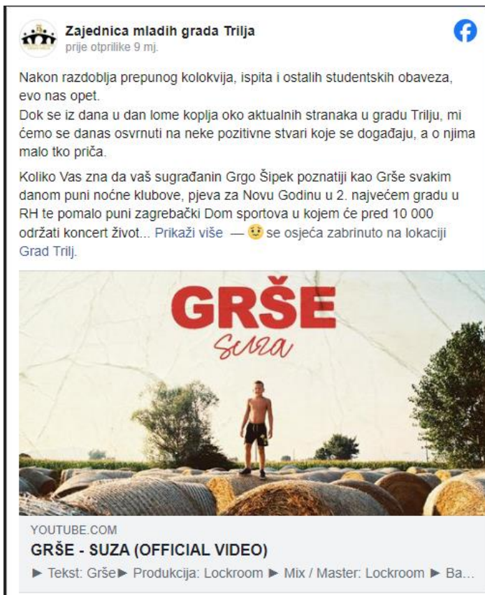
Snimak zaslona FB stranice Zajednica mladih grada Trilja