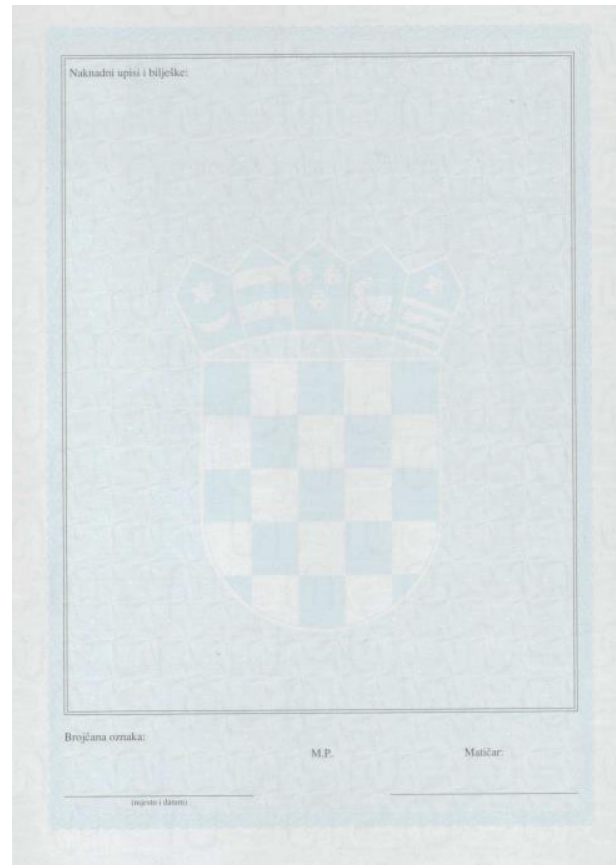
Slika 3. Izvadak iz matice rođenih