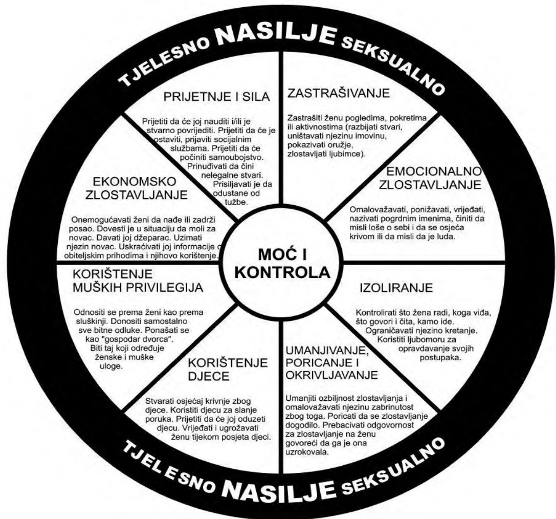
Slika 1. Kotač moći i kontrole koji opisuje nasilni odnos (Pence i Paymar, 1986 u: Ajduković i sur., 2000).

U oštroj suprotnosti s „Kotačem moći i kontrole“ je takozvani „Kotač jednakosti“ kojeg označava nenasilje, poštovanje, povjerenje, podrška, iskrenost, partnerstvo, odgovorno roditeljstvo (Ajduković i sur., 2000).