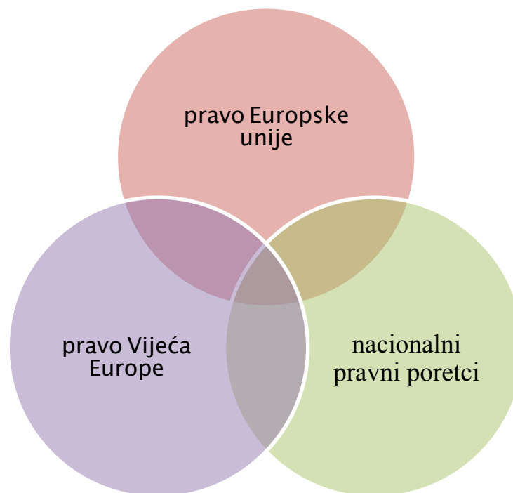
Slika 4 – Položaj ljudskog dostojanstva u europskom pravnom poretku (u širem smislu)

Dakle, ako bismo nastojali pozicionirati ljudsko dostojanstvo unutar složenog pravnog poretka koji karakterizira EU, ono je zaštićeno u trijasi međusobno isprepletenih pravnih sustava (Slika 4):