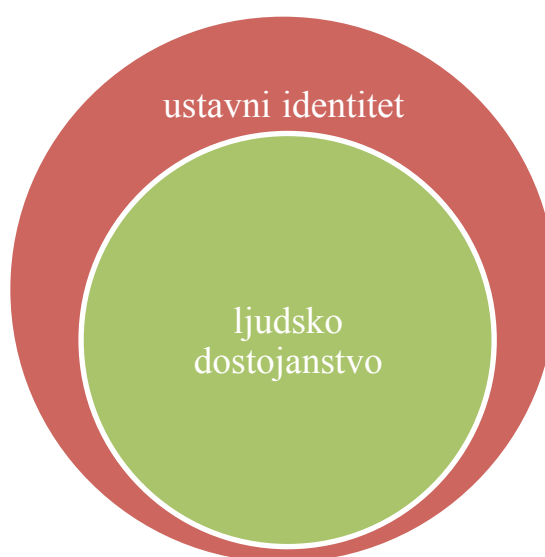
Slika 1 – Odnos ustavnog identiteta i ljudskog dostojanstva

Odnos ustavnog identiteta i ljudskog dostojanstva sa stajališta tuzemnih pravnih poredaka prikazan je na Slici 1.