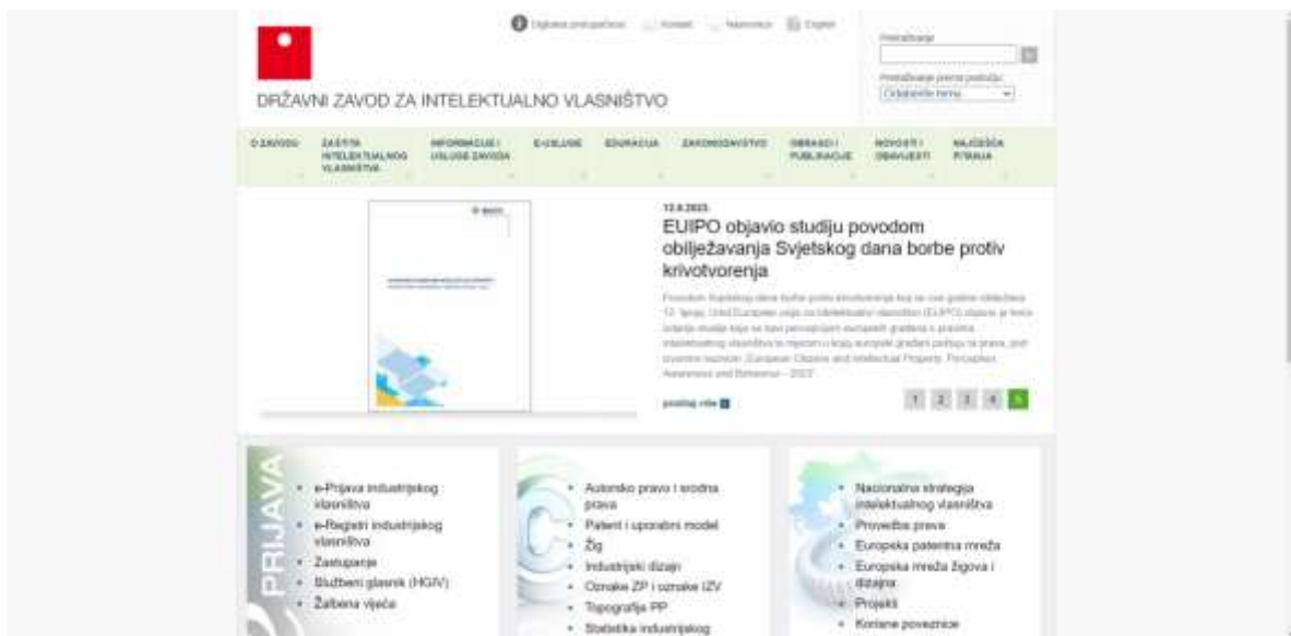
Slika 4. Internetska stranica Državnog zavoda za intelektualno vlasništvo