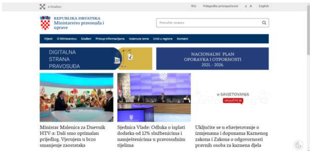
Slika 2. Primjer: internetska stranica Ministarstva pravosuđa i uprave