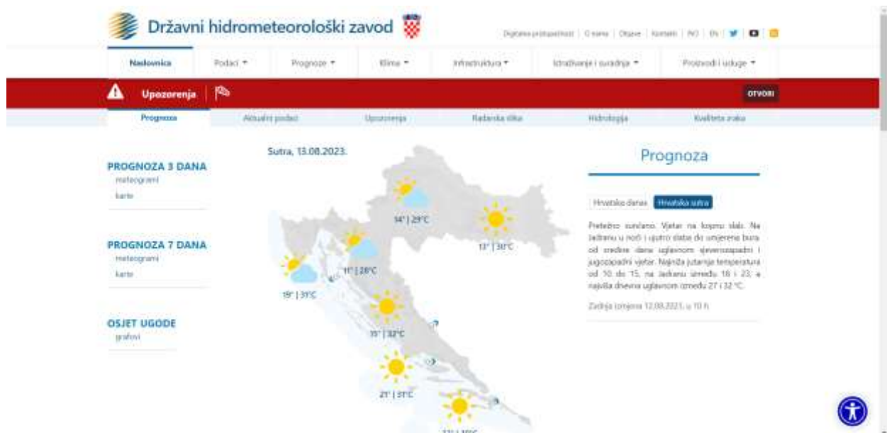
Slika 3. Internetska stranica Državnog hidrometeorološki zavoda