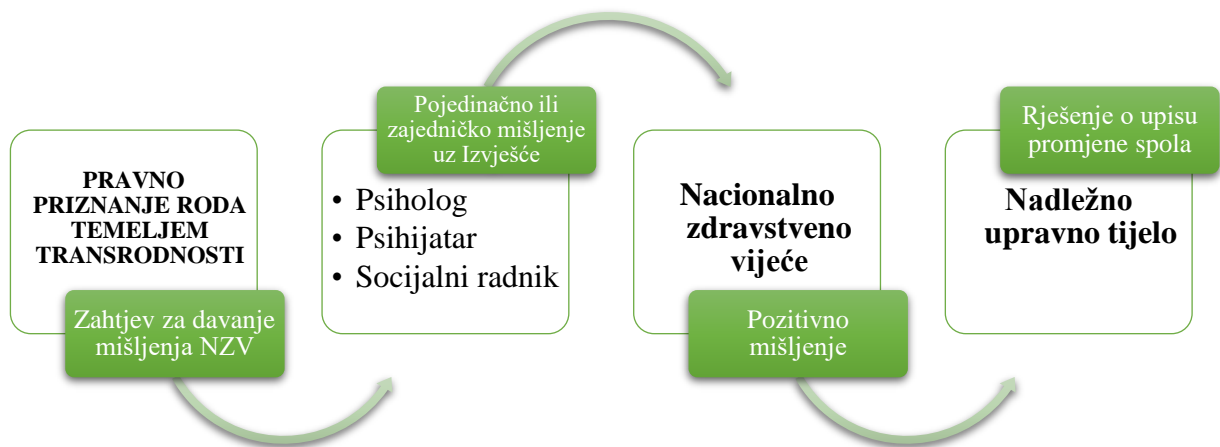
Slika 3. Postupak izrade mišljenja o utvrđivanju uvjeta i pretpostavki za promjenu spola na temelju života u drugom rodnom identitetu