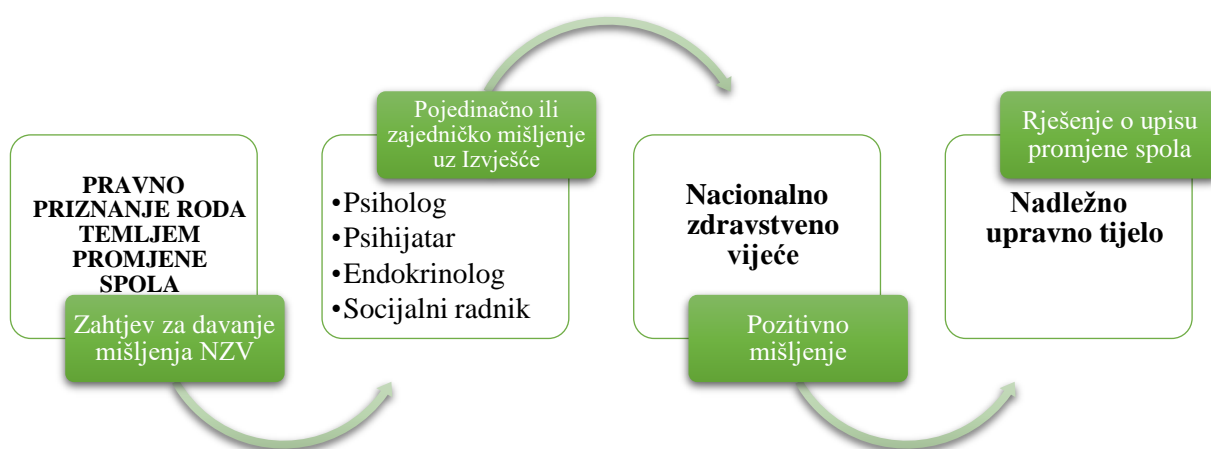
Slika 1. Postupak izrade mišljenja o utvrđivanju uvjeta i pretpostavki za promjenu spola transseksualnih osoba

Standardizirani postupak izrade mišljenja o utvrđivanju uvjeta i pretpostavki za promjenu spola i životu u drugom rodnom identitetu opisan je u Stručnim smjernicama za izradu mišljenja zdravstvenih radnika i psihologa o utvrđivanju uvjeta i pretpostavki za promjenu spola i životu u drugom rodnom identitetu (NN 7/16).