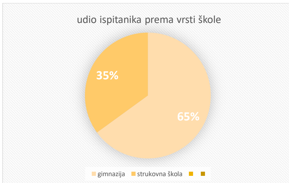
Graf 3.3 – udio ispitanika prema vrsti škole koju pohađaju