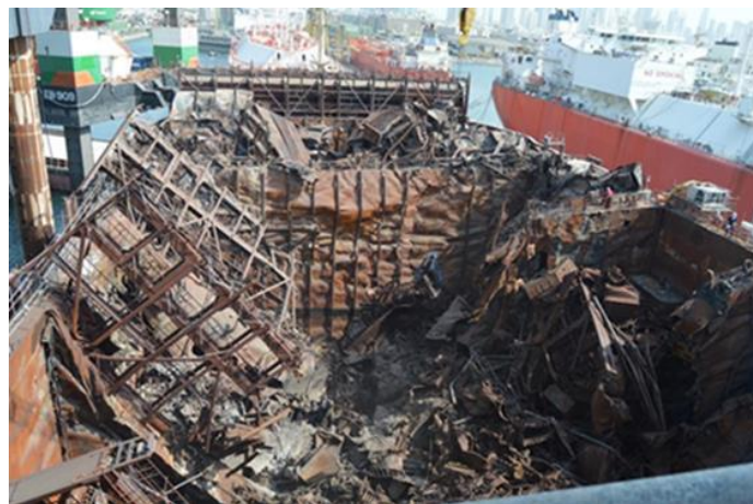
Slika 4. Posljedica požara na brodu Maersk Honam

U tom kontekstu valjalo bi prikazati rezultat likvidacije zajedničke havarije broda Maersk Honam. Maersk Honam je kontejnerski brod u vlasništvu tvrtke AP Moller Singapore Pte Ltd. iz Singapura, registriran u Singapuru, a charterer na temelju brodarskog ugovora je tvrtka Maersk Line iz Danske te je na putu od Singapura do Sueskog kanala 6. ožujka 2018 nastao požar među kontejnerima. 99