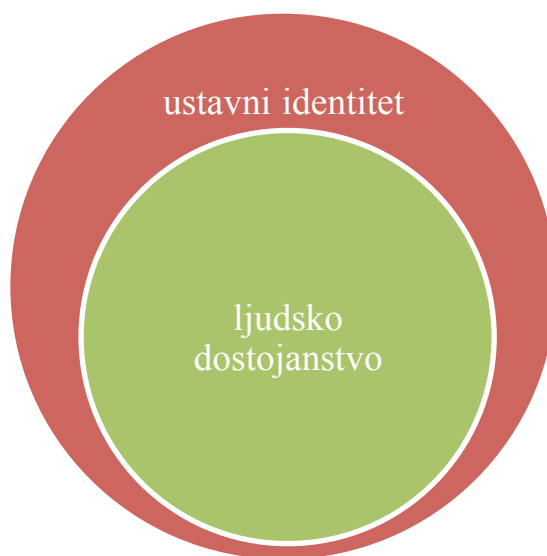
Slika 1 – Odnos ustavnog identiteta i ljudskog dostojanstva

Odnos ustavnog identiteta i ljudskog dostojanstva sa stajališta tuzemnih pravnih poredaka prikazan je na Slici 1.