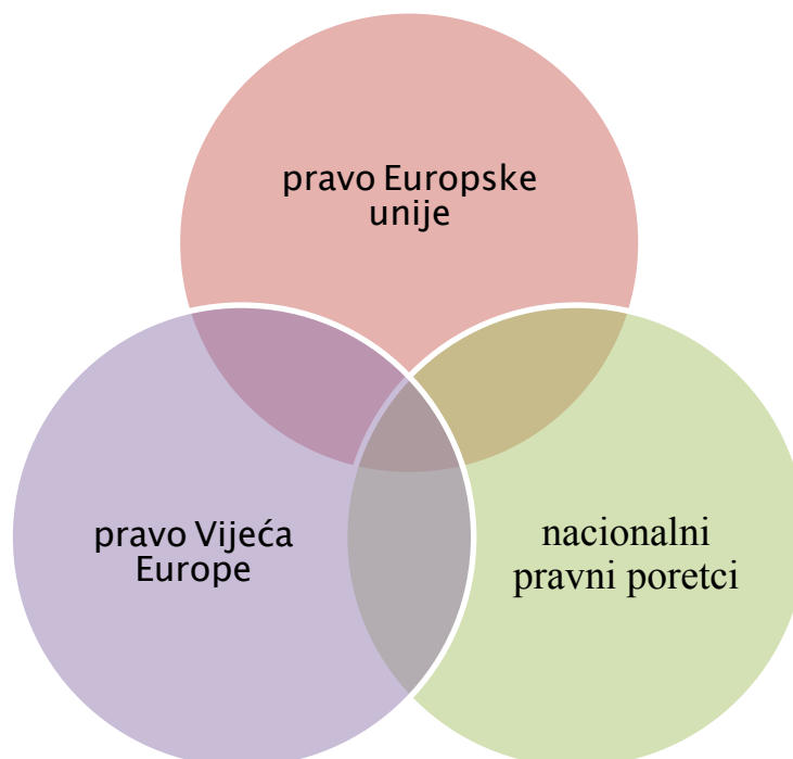
Slika 4 – Položaj ljudskog dostojanstva u europskom pravnom poretku (u širem smislu)

Dakle, ako bismo nastojali pozicionirati ljudsko dostojanstvo unutar složenog pravnog poretka koji karakterizira EU, ono je zaštićeno u trijasi međusobno isprepletenih pravnih sustava (Slika 4):