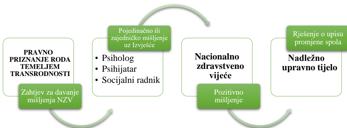
Slika 3. Postupak izrade mišljenja o utvrđivanju uvjeta i pretpostavki za promjenu spola na temelju života u drugom rodnom identitetu