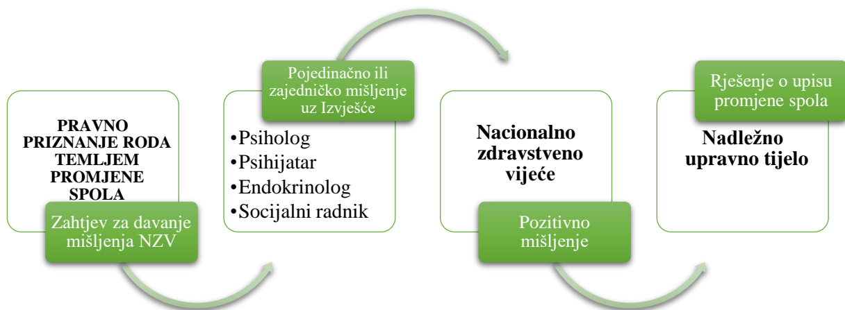
Slika 1. Postupak izrade mišljenja o utvrđivanju uvjeta i pretpostavki za promjenu spola transseksualnih osoba

Standardizirani postupak izrade mišljenja o utvrđivanju uvjeta i pretpostavki za promjenu spola i životu u drugom rodnom identitetu opisan je u Stručnim smjernicama za izradu mišljenja zdravstvenih radnika i psihologa o utvrđivanju uvjeta i pretpostavki za promjenu spola i životu u drugom rodnom identitetu (NN 7/16).