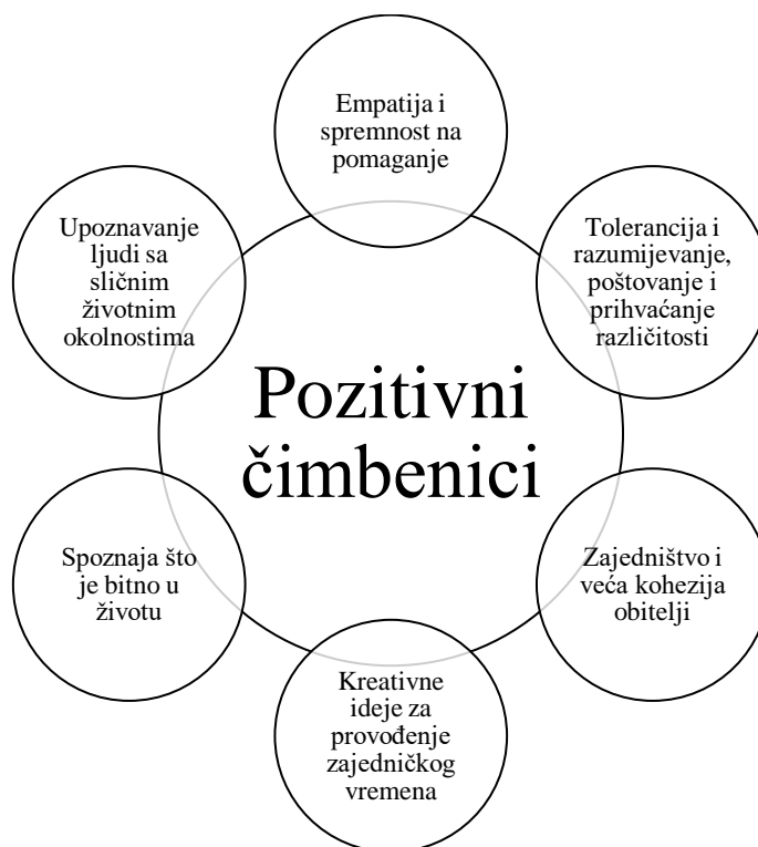
Slika 3.2. Klasifikacija pozitivnih čimbenika koji utječu na stakleno dijete i na njegovu kvalitetu života