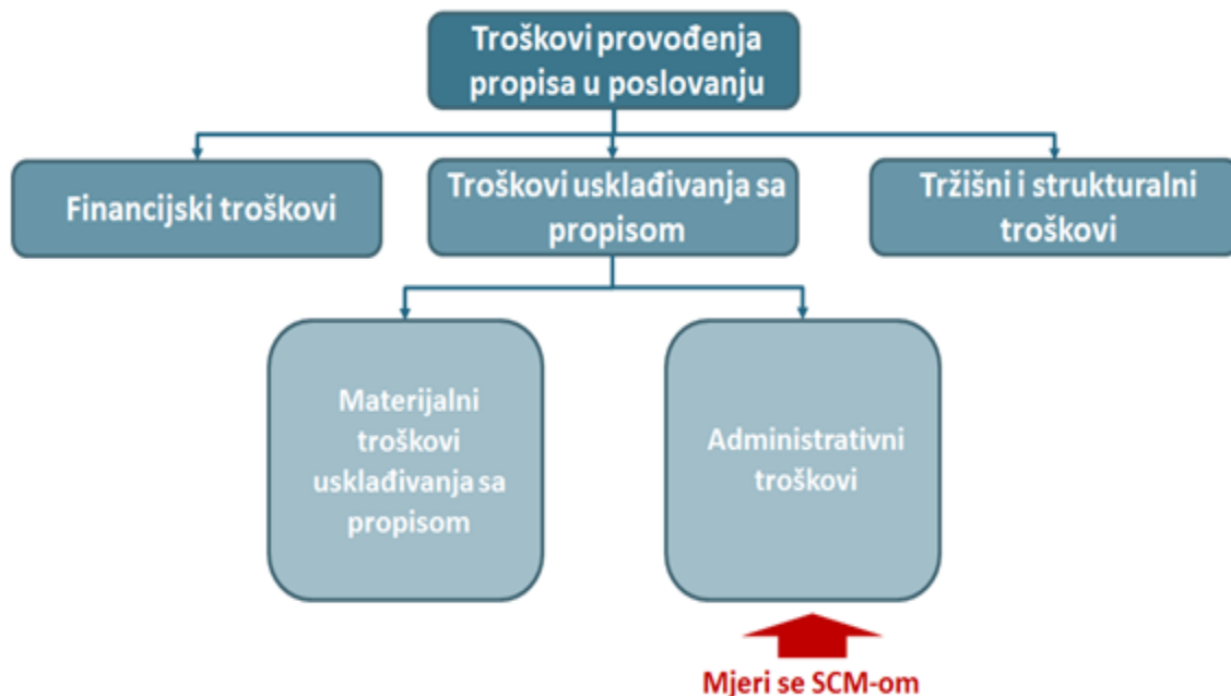
Slika 5. Troškovi primjene propisa.

Nacrti prijedloga zakona, mogu isto kao i zakoni na snazi, generirati različite troškove za gospodarstvo. Administrativni troškovi, kao posljedica usklađivanja poslovanja s propisom, jedni su od njih. Na slici 5. pogledajmo troškove primjene propisa kroz proces poslovanja.