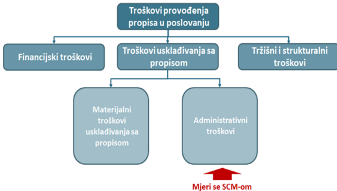
Slika 5. Troškovi primjene propisa.

Nacrti prijedloga zakona, mogu isto kao i zakoni na snazi, generirati različite troškove za gospodarstvo. Administrativni troškovi, kao posljedica usklađivanja poslovanja s propisom, jedni su od njih. Na slici 5. pogledajmo troškove primjene propisa kroz proces poslovanja.