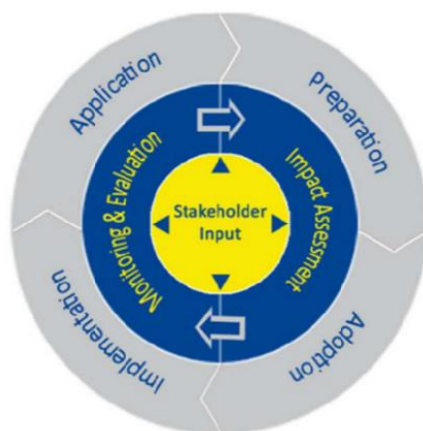
Slika 1. Slikovit opis politike "bolje i pametne regulacije" u postupku donošenja propisa na EU razini. 26

„Uvidjevši rezultate agende "bolje regulacije", 2010.g. Komisija donosi „Komunikaciju – Pametna regulacija u EU“ kojom usavršava korištenje regulatornih instrumenata procjene učinaka propisa, savjetovanja s javnošću, upravne simplifikacije i dopunjuje ih idejom "pametne regulacije" kojom se fokus širi na cjelokupan proces donošenja, implementacije, primjene, evaluacije i revizije propisa te intenzivnijeg uključivanja javnosti u spomenute faze.“ 25