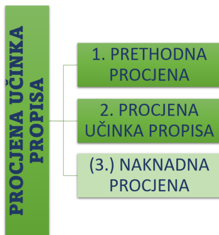
Slika 4. Redosljed postupka procjene učinaka propisa.

Postaje jasno kako naknadna procjena nije osnovna sastavnica instrumenta procjene učinaka propisa te da predstavlja iznimku kada procjena nije moguća u redovitim okolnostima. Pojednostavljeni prikaz instrumenta pogledajte na slici 4.