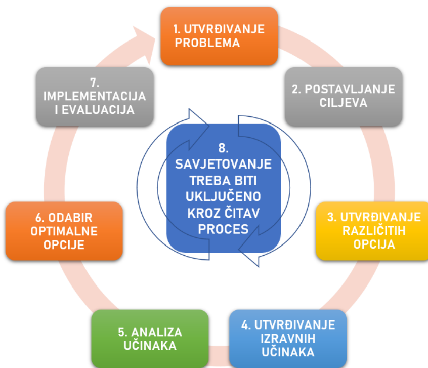
Slika 2. Metodološki koraci procjene učinaka propisa u RH-a.

8. Savjetovanje/konzultacije s javnošću – riječ je o pravu na sudjelovanje u procesu odlučivanja. Obuhvaća dvije komponentne: 1. Pravo pristupa informacijama tijela javne vlasti (transparentnost kao cilj javne politike) te 2. Pravo javnosti na sudjelovanje u procesu donošenja odluka tijela javne vlasti (savjetovanje sa zainteresiranom javnošću – "eSavjetovanje" – otvorenost tijela javne vlasti kao cilj javne politike). 31