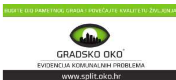
Slika 5. Gradsko oko Split

Sustav Gradsko oko služi za kreiranje, zaprimanje, prosljeđivanje i pregled prijava uočenih problema u domeni komunalnog sustava jedinice lokalne samouprave. Kako bi se postavilo pitanje ili prijavio problem, potrebno je prijaviti se sa svojim korisničkim podacima. Informatički sustav Gradsko oko kreiran je za potrebe gradskog komunalnog odjela, a ujedno omogućava i dvosmjernu komunikaciju i pristup raznim sudionicima i građanima. Sustav omogućuje uključivanje širokog broja sudionika u jednostavno stvaranje evidencije komunalnih problema. 22