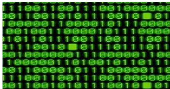
Slika 2: primjer računalnog programa u strojnom kôdu 10