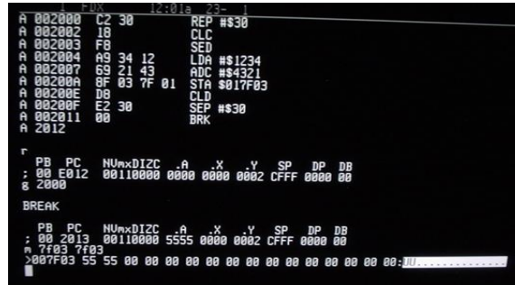
Slika 3: primjer računalnog programa u objektivnom kôdu 11