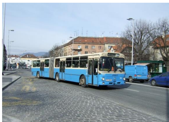
Slika 7. Stari autobus ZET-a