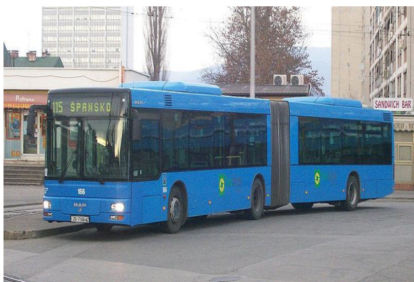
Slika 8. Novi autobus ZET-a