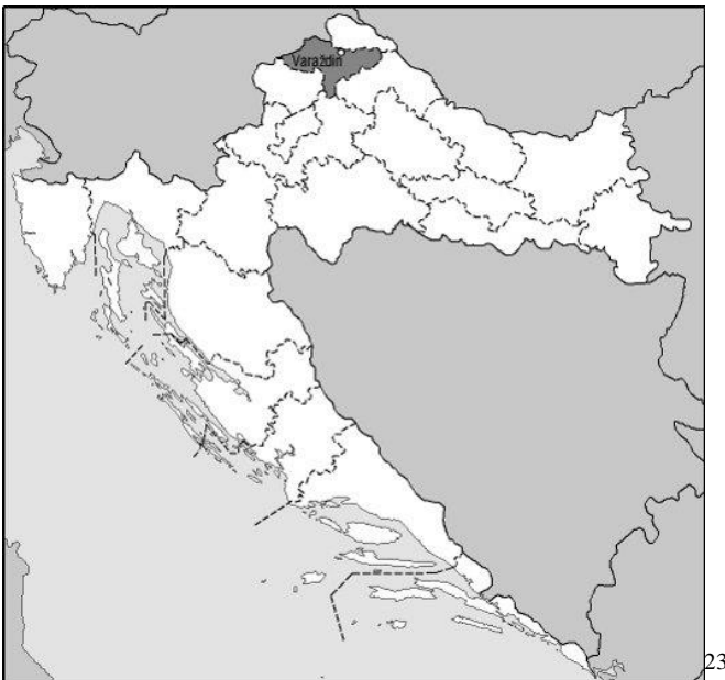
Slika 1. Položaj Varaždinske županije u RH

Varaždinska županija se nalazi u sjeverozapadnom dijelu Hrvatske i prema popisu stanovništva iz 2021. ima 160 264 stanovnika te je površinom 1261,29 km 2 treća najmanja županija u državi no ujedno i jedna od najgušće naseljenih. Županija ima šest gradova i dvadeset dvije općine. Sjedište županije je jedan od najstarijih hrvatskih gradova, Varaždin. Najveća gustoća naseljenosti je oko Grada Varaždina, u sjevernom dijelu županije. Karakteristika županije je velikih broj manjih naselja te je koncentracija stanovništva u gradskim naseljima niža od prosjeka RH. Zbog svega toga cestovna mreža županije je razvijena, iako se radi najviše o regionalnim i lokalnim cestama. Javni prijevoz na području županije je reguliran na temelju dva prometna moda: autobusnog županijskog linijskog prijevoza i željezničkog prometa. 22