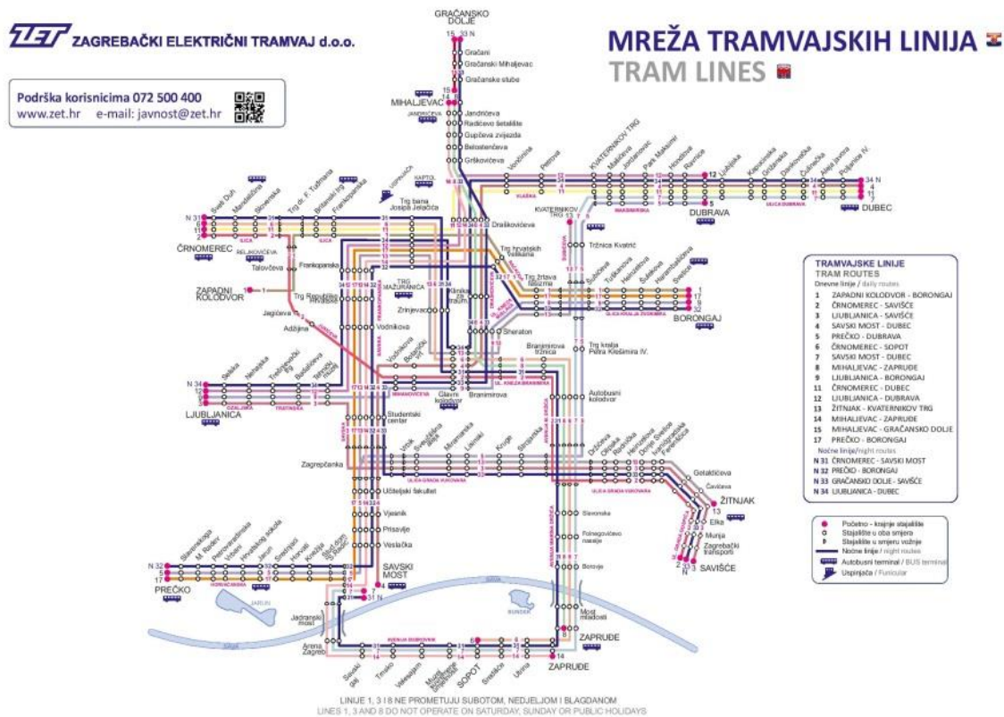
Slika 6. Nacrt tramvajskih linija Grada Zagreba

Tramvajska mreža je organizirana tako da ima 15 dnevnih (oko 4 – 12 navečer) i 4 noćne linije (12-4 ujutro). Određene dnevne linije ne prometuju vikendima i državnim praznicima. Noćne linije organizirane su tako da pokrivaju većinu dnevnih linija ali smanjenom frekvencijom.