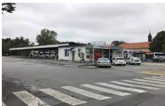
Slika 2. Autobusni kolodvor prije obnove Slika 3. Autobusni kolodvor poslije obnove

Jedino značajno ulaganje bilo je u Varaždinu gdje je 2018. godine obnovljen autobusni kolodvor koji služi kao središnji autobusni kolodvor u županiji.