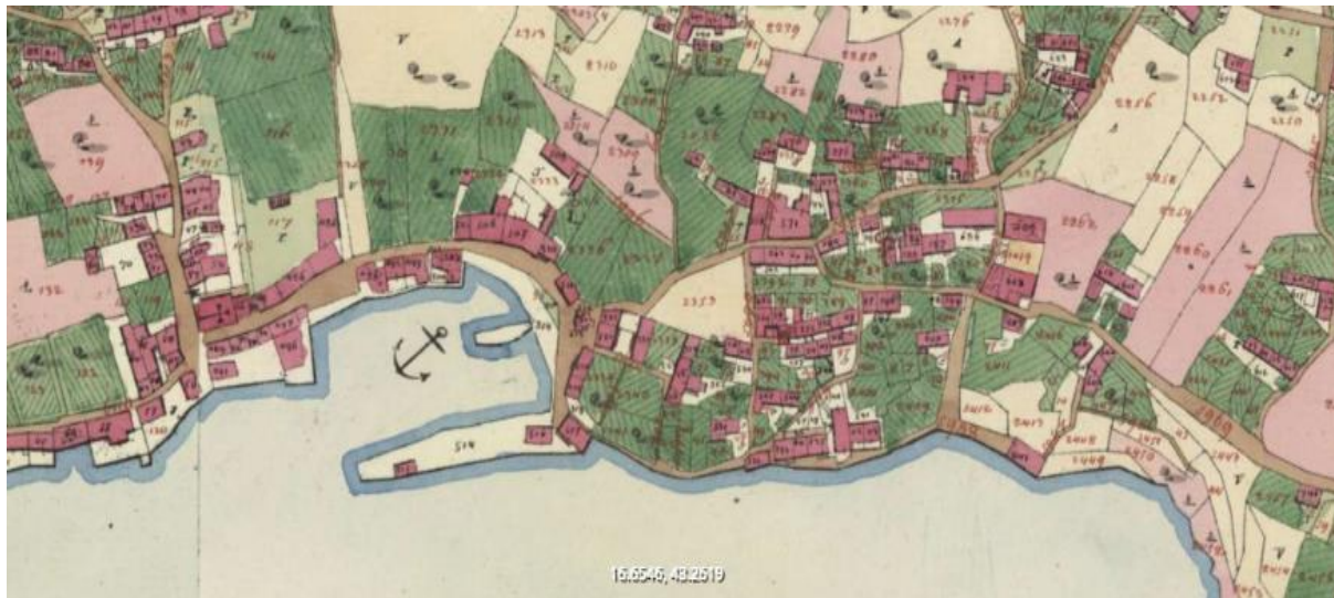
Sl. 1. Katastarski plan k.o. Bol (detalj) iz 1833.