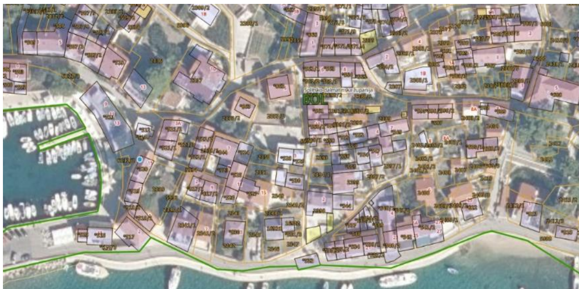
Sl 3. Trenutno važeći katastarski plan k.o. Bol (detalj).