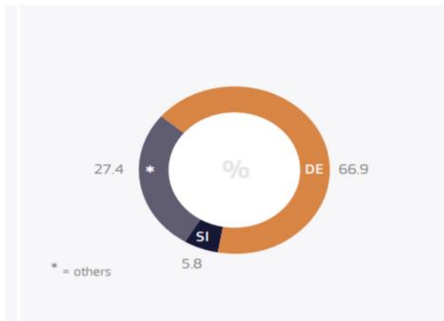
Slika 2: Glavna država izaslanja radnika iz Hrvatske (2016)